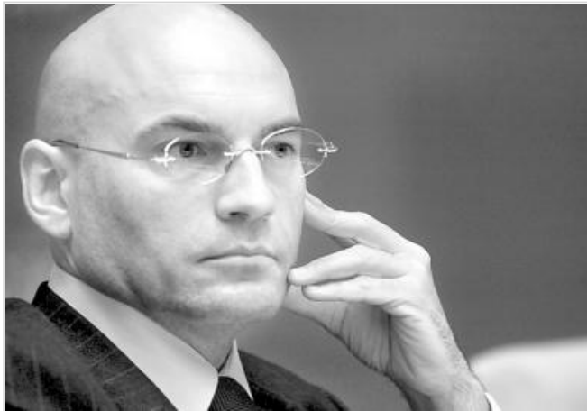
Imagen del Juez .

En mi opinión, D. Javier Gómez Bermúdez , Presidente y ponente de la Sala de lo Penal de la Audiencia Nacional para el Juicio del 11M , sabe lo que se hace y cómo se hace . También tiene claro que para saber algún día lo que pasó [toda la verdad posible] hay que comenzar por descartar lo que no pasó [justos por pecadores]. En esas creo que, de momento, estamos.